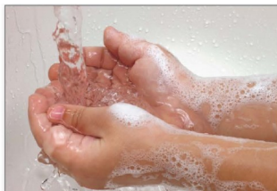
Rửa tay sau khi chơi hoặc làm việc ngoài vườn