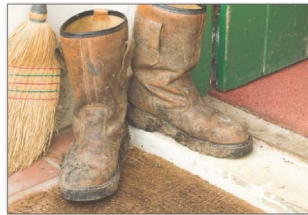
Cởi giày dép trước khi vào nhà