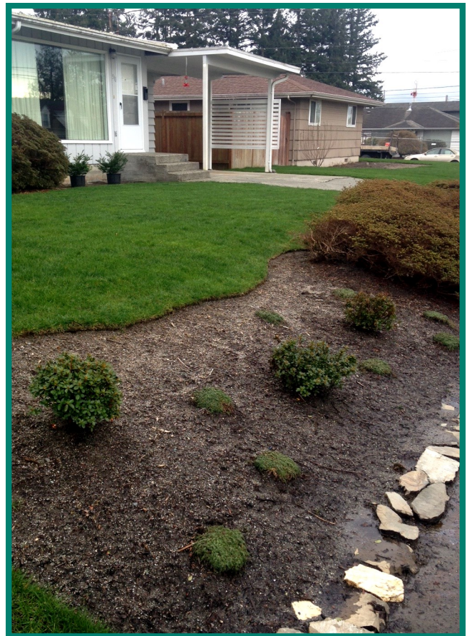
Khu vườn của dân cư được phục hồi trong năm 2015.

Cám ơn quý vị đã tham gia đóng góp ý kiến cho bản báo cáo môi trường ở vùng đất thấp (Lowlands Area Environmental Reports) vào tháng 10 và 11 năm 2015. Chúng tôi đã xem xét thông tin phản hồi và hoàn thiện bản báo cáo này. Cơ hội tiếp là giai đoạn đóng góp ý kiến cho bản thảo kế hoạch dọn sạch (Draft Cleanup Action Plan) dự kiến vào mùa hè này.