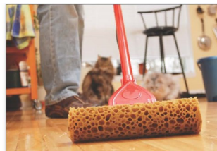
Lau nhà thường xuyên