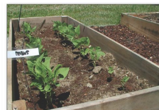
Trồng hoa và cây kiểng trong bồn.

Nếu quý vị muốn có tài liệu này trong một thể dạng khác, xin liên lạc số điện thoại 425-649-7000. Quý vị có khuyết tật nghe, xin gọi 711 đến Washington Relay Service. Khuyết tật nói, xin gọi số 877-833-6341.