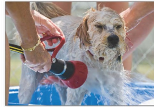
Giữ thú nuôi sạch sẽ