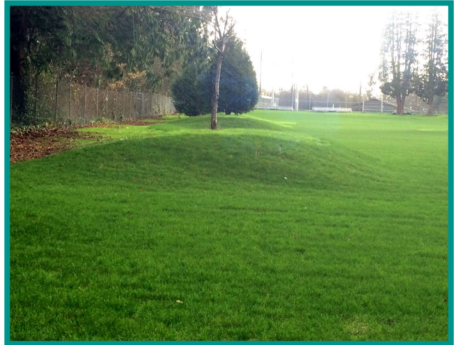
Bộ Môi Sinh đã di dời đất nhiễm tại công viên American Legion và thay thế bằng đất sạch, phục hồi sân cỏ và cây trồng.