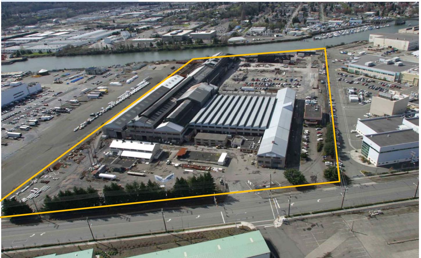
Figura 1. Foto aérea del sitio Jorgensen Forge y el LDW con límites del sitio.

Varias limpiezas de sedimentos ya se han completado y muchas acciones para controlar las fuentes de contaminación también se están llevando a cabo. Para más información vea la Estrategia de Ecología para Controlar Fuentes: https://fortress.wa.gov/ecy/gsp/DocViewer.ashx?did=56204 .