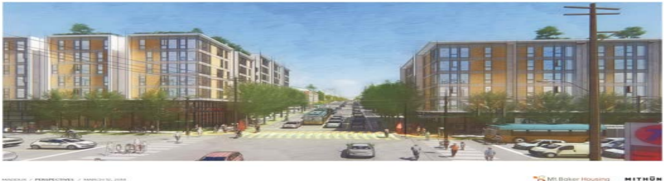
Figura 1 Dibujo de concepto del proyecto de vivienda asequible Mount Baker (foto cortesía de Mount Baker Housing Association).