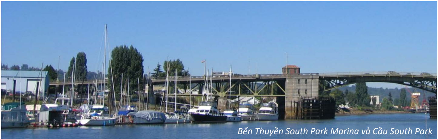
Bến Thuyền South Park Marina và Cầu South Park