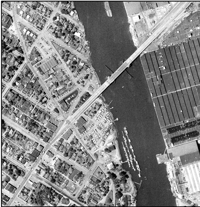
South Park Marina historical picture