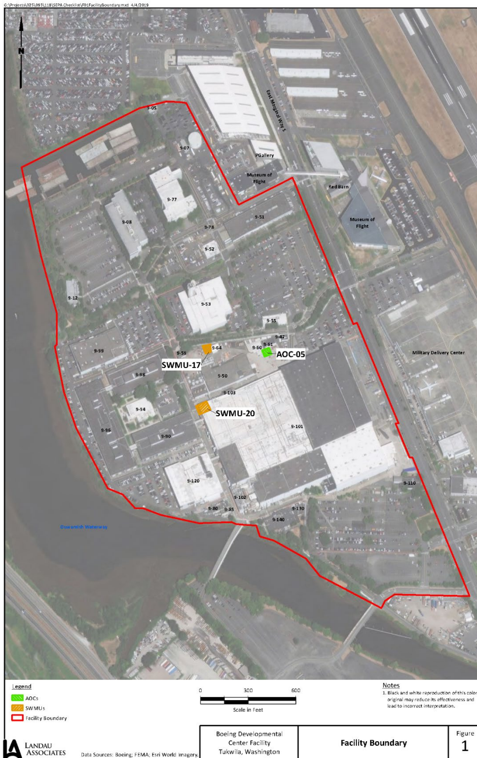
Figure 1. Bản Đồ của lô bất động sản Boeing Developmental Center với 3 khu vực hiện đang được làm sạch.