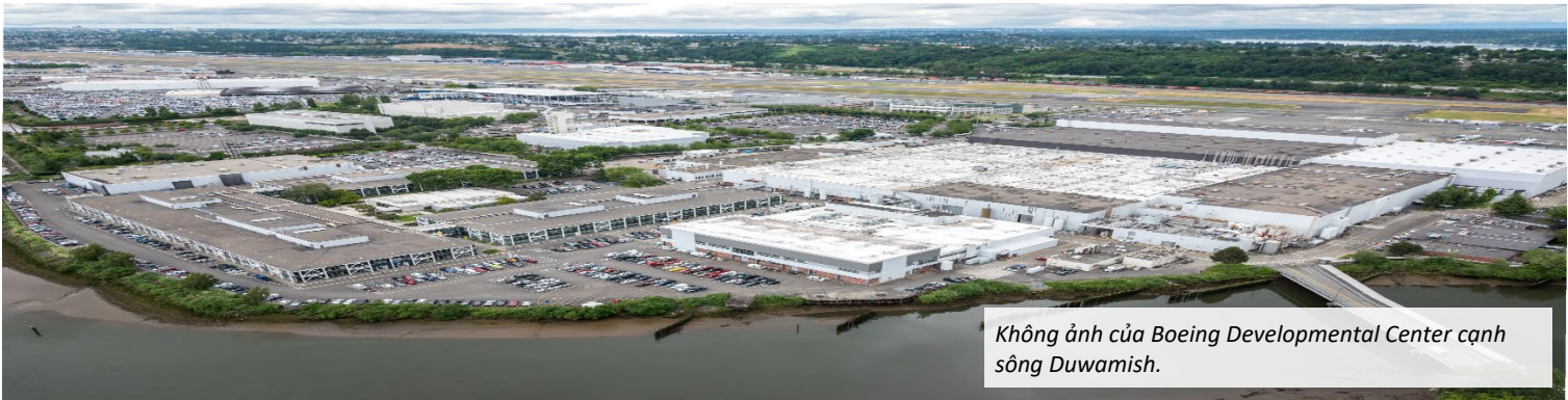
Không ảnh của Boeing Developmental Center cạnh sông Duwamish.