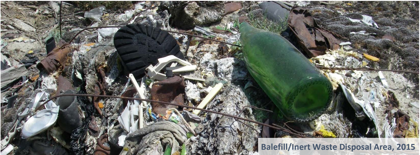
Balefill/Inert Waste Disposal Area, 2015