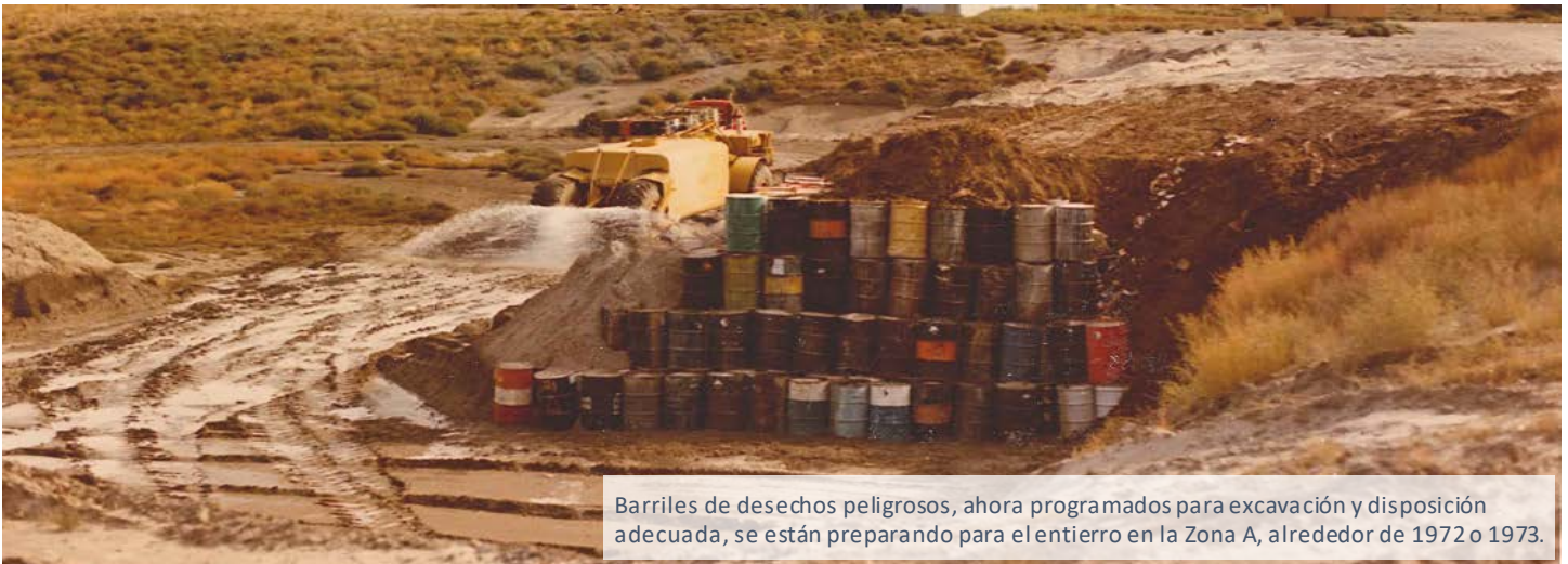
Barriles de desechos peligrosos, ahora programados para excavación y disposición adecuada, se están preparando para el entierro en la Zona A, alrededor de 1972 o 1973.