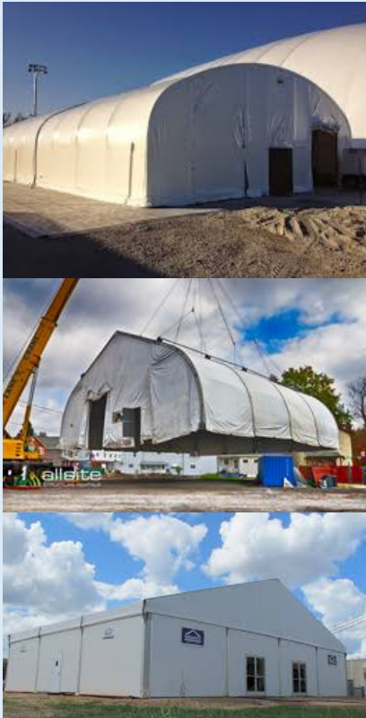
Figura 1. Se construirá una estructura temporal sobre Zona A para eliminar las posibles emisiones de las actividades de trabajo. Ver R1 para más detalles.

procedimientos de contingencia se ha desarrollado con las autoridades locales y los servicios de emergencia. También se implementará un plan de tráfico, que se coordinará con negocios locales.