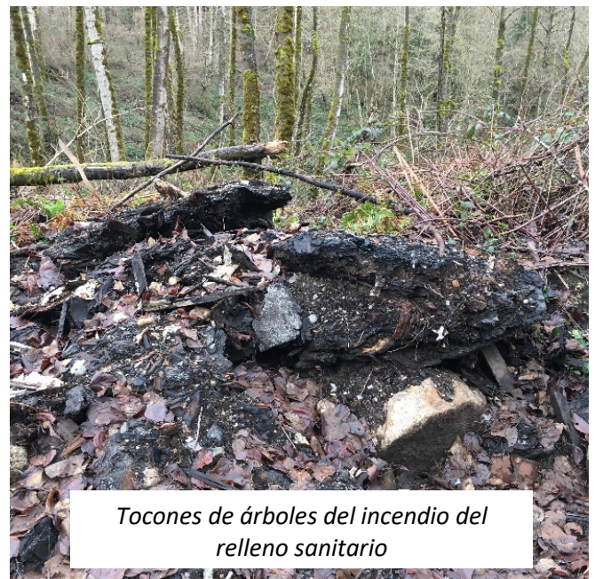
Tocones de árboles del incendio del relleno sanitario

En 1974, Rekaway aceptó aproximadamente 200 yardas cúbicas de polvo de casa de bolsas que contenía polvos de magnesio, fosfato y aluminio en el relleno sanitario. Un incendio resultó de la oxidación de los polvos metálicos enterrados. El material fue excavado, extendido en el suelo y extinguido y luego cubierto con tierra. Los árboles y tocones parcialmente quemados causaron un incendio en el relleno sanitario en noviembre de 1976 que persistió