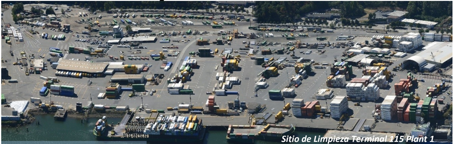
Sitio de Limpieza Terminal 115 Plant 1