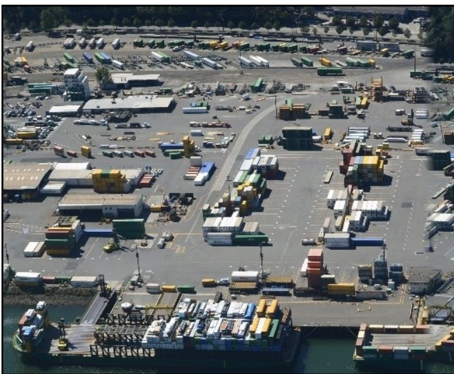
Vista aérea del sitio Terminal 115 Plant 1