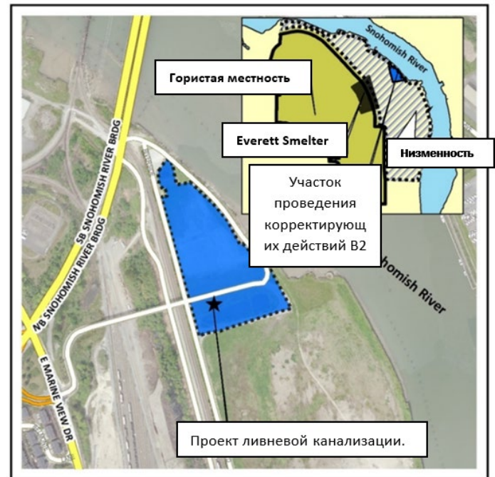
Участок, на котором будут проводиться работы с ливневой канализацией (район B2), расположен вдоль Snohomish River, к востоку от моста через Snohomish River.

В этом году Департамент экологии вместе с муниципалитетом ("Город") будет работать над улучшением существующей системы ливневой канализации в северо-восточной части г. Everett. Эта система водостоков и трубопроводов переносит дождевые воды под землёй с окружающей территории в Snohomish River. В 2016 году Департамент экологии проверил водосточные трубы в этом районе (Район B2) и обнаружил мелкие трещины. Эти трещины позволяют подземным водам проникать в канализационную систему, выходящую в Snohomish River. Данная канализационная система находится в пределах участка очистки Everett Smelter, и подземные воды могут быть загрязнены мышьяком. В этом году Департамент экологии вместе с муниципалитетом ("Город") будет работать над улучшением существующей системы ливневой канализации в северо-восточной части г. Everett. Эта система водостоков и трубопроводов переносит дождевые воды под землёй с окружающей территории в Snohomish River. В 2016 году Департамент экологии проверил водосточные трубы в этом районе (Район B2) и обнаружил мелкие трещины. Эти трещины позволяют подземным водам проникать в канализационную систему, выходящую в Snohomish River. Данная канализационная система находится в пределах участка очистки Everett Smelter, и подземные воды могут быть загрязнены мышьяком.