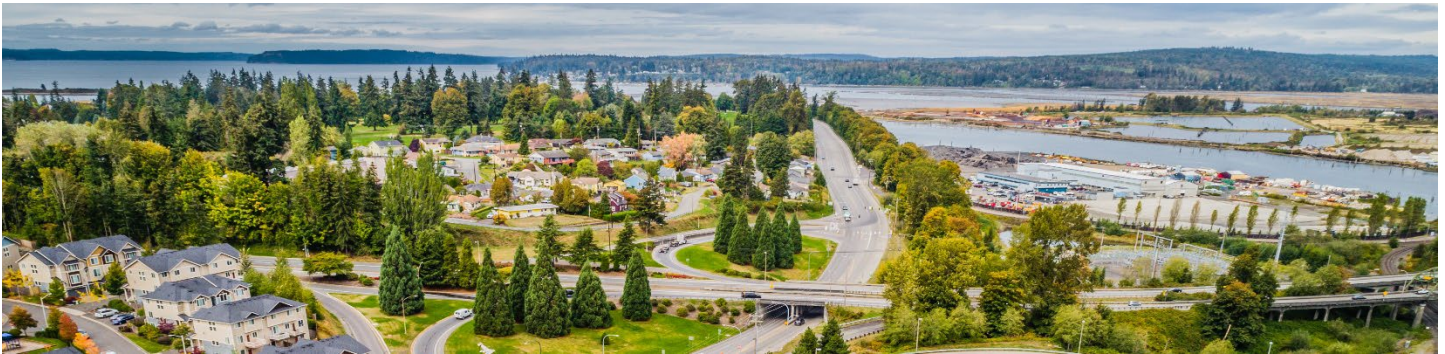
Северная часть г. Everett, вид на север вдоль East Marine View Dr.