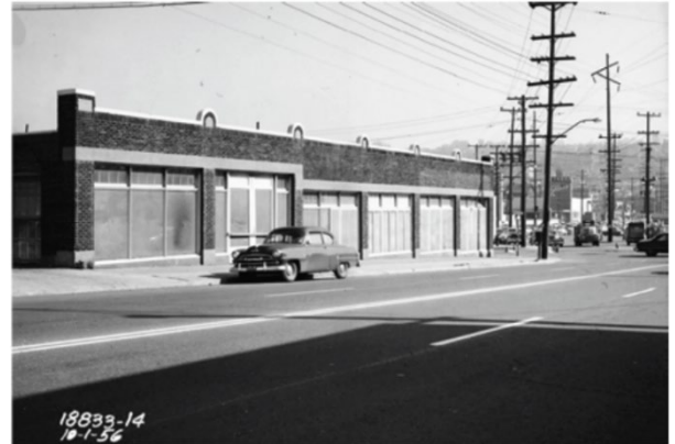
1 de octubre de 1956. Fotografía del lado sur de la propiedad en los archivos municipales de Seattle.

El sitio se ubica en el vecindario South Lake Union, en Seattle, a una cuadra de Lake Union. Está formado por cuatro parcelas del condado de King. Las parcelas se ubican dentro del alcance histórico de Lake Union y fueron llenadas como parte de la renivelación regional a principios de la década de 1900. El sitio fue la sede de una exhibición de automóviles y de varios servicios automovilísticos desde la década de 1920 hasta 2019. Las estructuras originales del área fueron demolidas en 2021, en el marco de los preparativos para la renovación. El sitio actualmente funciona como un estacionamiento para construcciones cercanas.