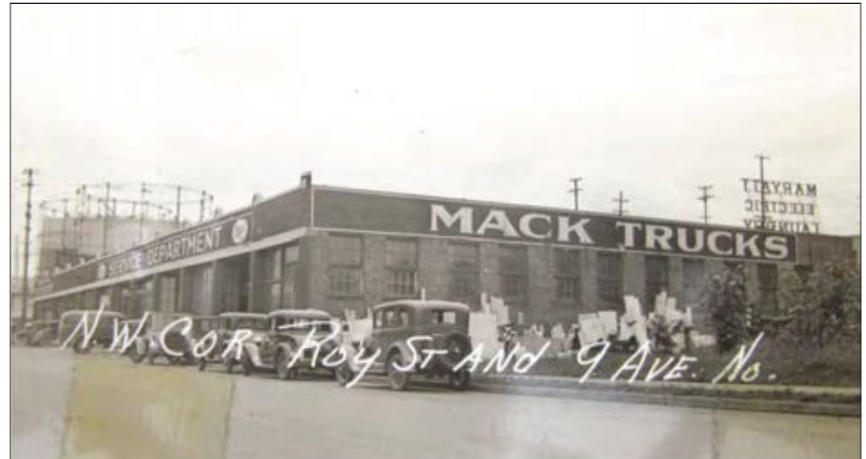
Fotografía histórica de 1937, que muestra el centro de servicios Mack Trucks y las exhibiciones automovilísticas en la propiedad.

Para cada uno de estos pasos se debe llevar a cabo un período de comentarios públicos. El gráfico que aparece debajo muestra las diferentes etapas de limpieza. En ocasiones, ocurren varias etapas en un solo período de comentarios.