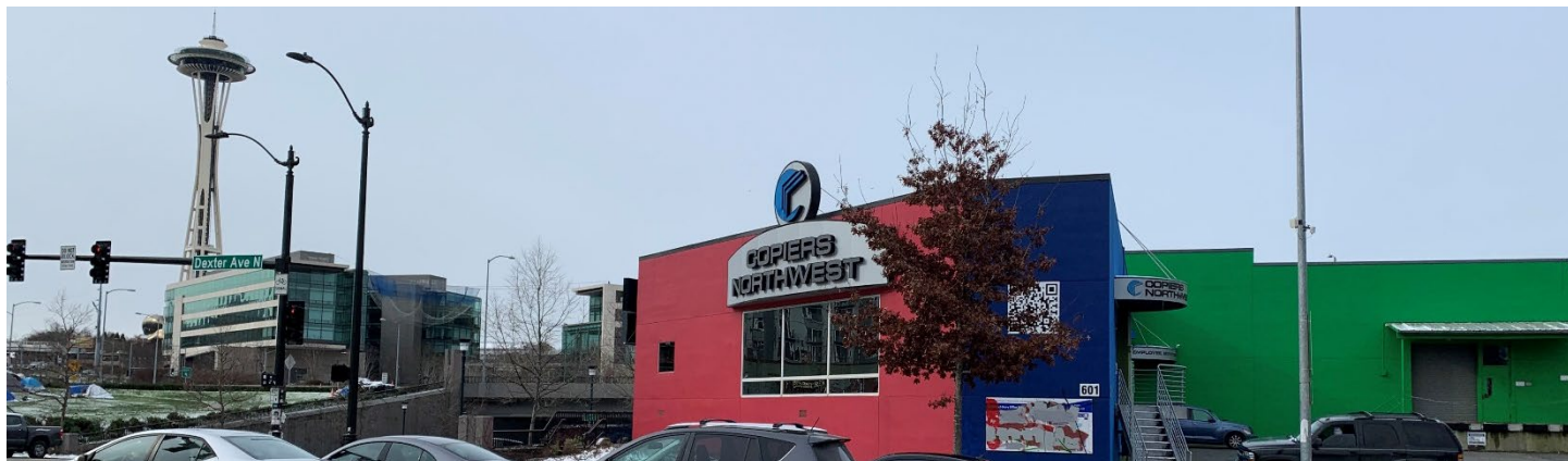
601 Dexter today