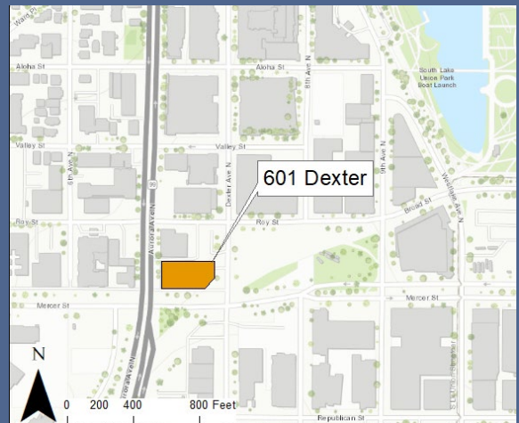
601 Dexter 清理工作站點位置

便利服務: 如需殘疾人法(ADA)便利服務，包括為視障人士設計的文件料，請致電生態署 206-594-0000，或訪問網站 https://ecology.wa.gov/accessibility 。聽力受損的人可以撥打華盛頓中繼服務電話 711。語言障礙人士可以撥打 TTY 電話 877-833-6341。