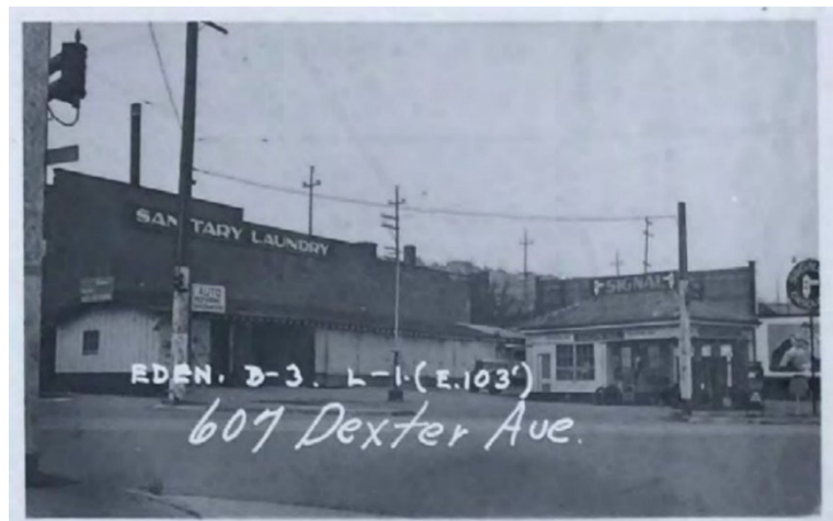
歷史的黑白照片展示了兩個建築結構和電線桿。