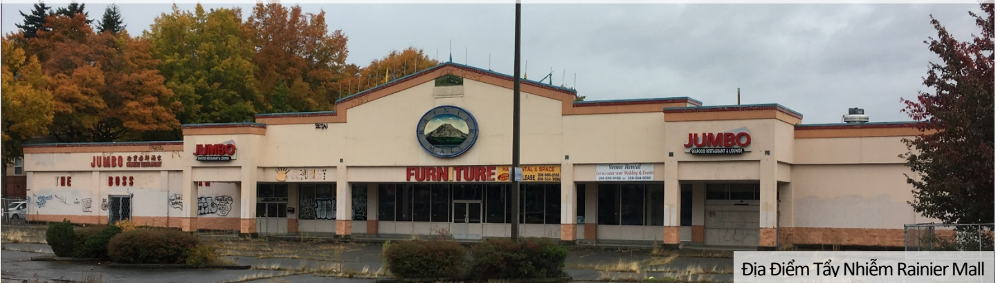
Địa Điểm Tẩy Nhiễm Rainier Mall