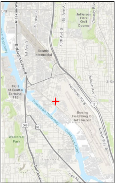
ទិដ្ឋភាពពីលើអាកាសនិងផែនទីនៃទីតាំងរោងចក្រចំហាយទឹកណ៍តបូអ៊ីងហ្វៀលដូចថោន (North Boeing Field-Georgetown Steam Plant Site) និងគំរូគម្រោងឧទ្យានឆ្នៃ (Dog Park Project Area).