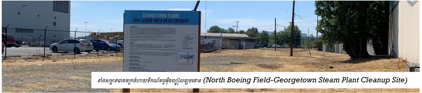
តាំងសម្អាតរោងចក្រចំហាយទឹកណាំតបូអ៊ីងហ្វៀលដូចម្តេច (North Boeing Field-Georgetown Steam Plant Cleanup Site)

សកម្មភាពបណ្តោះអាសន្ននៃរោងចក្រចំហាយទឹកណាំតបូអ៊ីងហ្វៀលដូចម្តេច