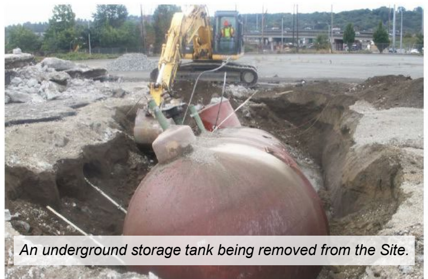
An underground storage tank being removed from the Site.

As a result, Ecology determines that the cleanup action conducted at this Site meets the state cleanup standards.