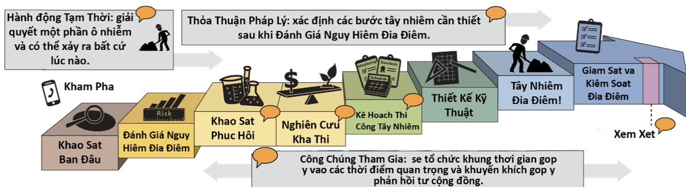
Hình 3. Đồ họa thông tin cho quy trình tẩy nhiễm chính thức.

Chúng tôi áp dụng cả các quy định của Đạo luật Bảo tồn và Phục hồi Tài nguyên (RCRA) và Đạo luật Mô hình Kiểm soát Chất độc (MTCA) để tẩy nhiễm các địa điểm chứa chất thải nguy hại. Việc tẩy nhiễm bảo vệ sức khỏe con người và môi trường khỏi các chất thải và hóa chất nguy hiểm.