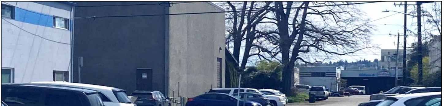
Hình 1: Quang cảnh các cơ sở Art Brass Plating, Blaser Die Casting, and Capitol Industries ở Địa điểm West of 4th tại Georgetown.