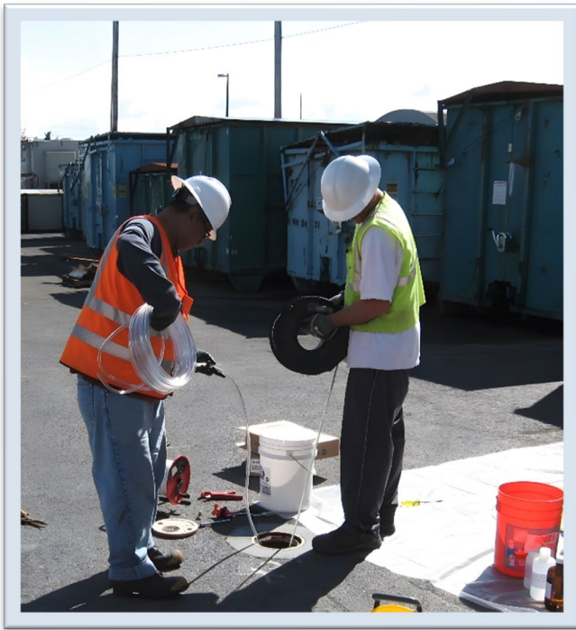
图 1. 测试 Occidental 站点的地下水。