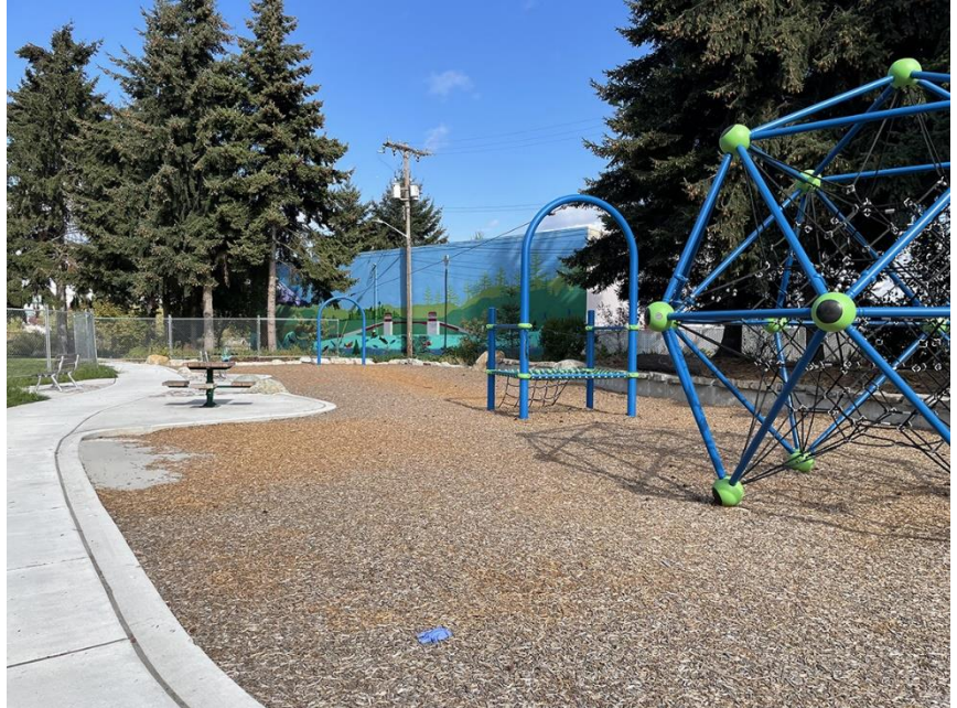
Khu sân chơi Duwamish Waterway Park, tháng 9 năm 2022

Nguyên 3 (VCP) cho phép chủ sở hữu các địa điểm bị ô nhiễm đáp ứng các tiêu chuẩn tẩy nhiễm của tiểu bang theo MTCA một cách độc lập và nhận được hướng dẫn kỹ thuật từ Ecology trong quá trình này. VCP cho phép chủ sở hữu làm việc trên cơ sở ợp đồng thay vì thiện pháp lý của Ecology. Những người tham gia VCP trả phí cho Ecology để trang trải chi phí hướng dẫn và thẩm định của bộ. Các địa điểm VCP phải đáp ứng các tiêu chuẩn tẩy nhiễm giống như các bất động sản do Ecology chính thức quản lý theo MTCA.