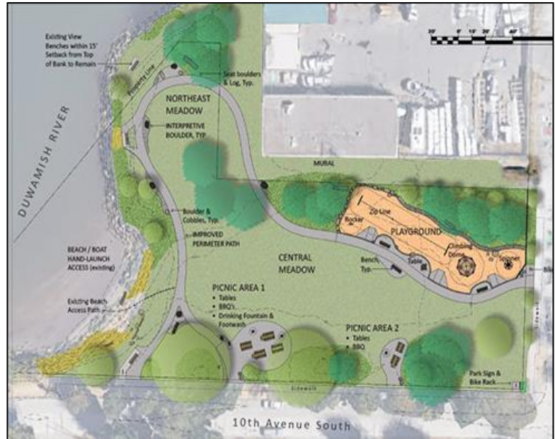
Bản vẽ kỹ thuật thể hiện các cải tiến công viên hiện tại và đang chờ xử

Những người bạn (Friends) của Duwamish Waterway Park đã dẫn đầu nỗ lực kéo dài nhiều năm để biến tầm nhìn của cộng đồng về một công viên lâu dài trong khu dân cư thành một thiết kế cuối cùng. Làm việc với SPR và Seattle Parks Foundation, Friends of Duwamish Waterway Park đã quyên góp được hơn một triệu đô la để cải thiện công viên. Việc xây dựng được hoàn thành vào cuối năm 2022. Công việc phục hồi địa điểm bắt đầu vào năm 2020 và vẫn tiếp tục cho đến ngày nay.