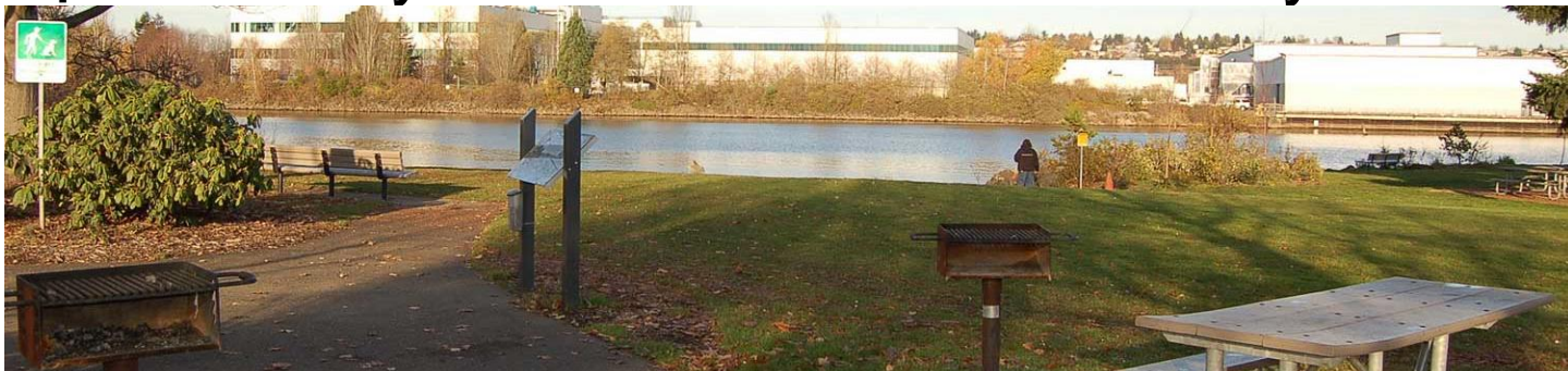
Bờ sông tại Duwamish Waterway Park