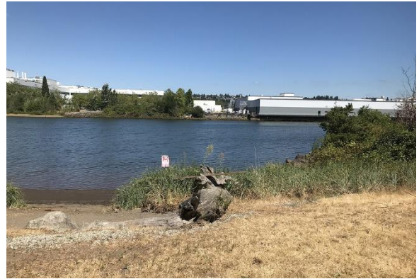
Quang cảnh Lower Duwamish Waterway từ Duwamish Waterway Park, tháng 8 năm 2022

Địa điểm Duwamish Waterway Park tiếp giáp với địa điểm Lower Duwamish Waterway 4 Superfund Site, bao gồm một đoạn sông Duwamish dài 5 dặm. Cơ quan Bảo vệ Môi trường Hoa Kỳ (EPA) đã thêm LDW Superfund Site 5 vào Danh sách Ưu tiên Quốc gia Superfund vào năm 2001. Ecology đang làm việc để ngăn chặn hoặc giảm thiểu các nguồn gây ô nhiễm cho Địa điểm LDW Superfund Site, một nỗ lực được gọi là " kiểm soát nguồn " 6 , để EPA có thể tiến hành tẩy nhiễm lớp trầm tích dưới sông.