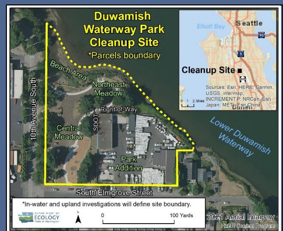
Duwamish 水道公园清理站点的航拍图, 2021 年

T如需殘疾人法(ADA)便利服務,請致電生態管理署425-324-5901, 或電子郵件 LDW@ecy.wa.gov 或 ecy.wa.gov/Accessibility . 可用的替代格式 877-833-6341 或 TTY 转接 711