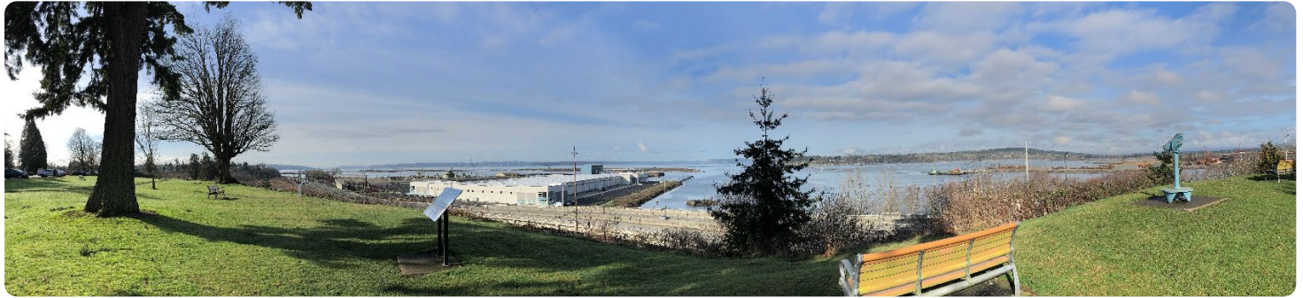
А Скамейки на смотровой площадке Hibulb с видом на место слияния Snohomish River и Puget Sound.