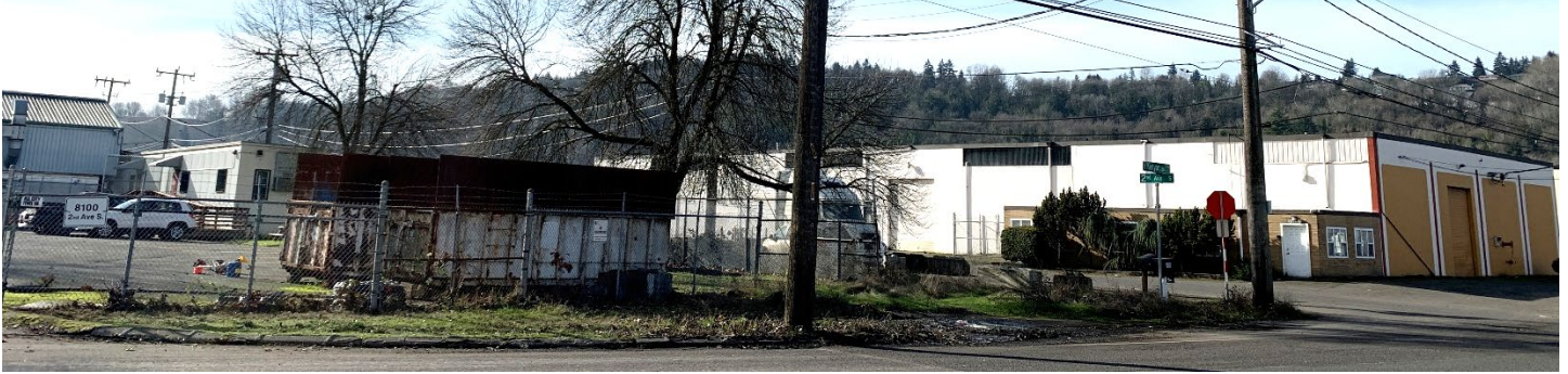
Sitio de limpieza de South Park Landfill desde S. Kenyon Street