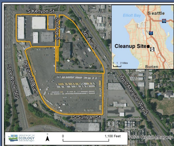
Mapa aéreo del sitio de limpieza de South Park Landfill en 2021

Para solicitar una adaptación en virtud de la Ley para Estadounidenses con Discapacidades (Americans with Disabilities Act, ADA), comuníquese con Ecology por teléfono al 425-229-3683, envíe un correo electrónico a LDW@ecy.wa.gov o visite ecology.wa.gov/Accessibility . Para solicitar el servicio de retransmisión o TTY, llame al 711 o al 877-833-6341.