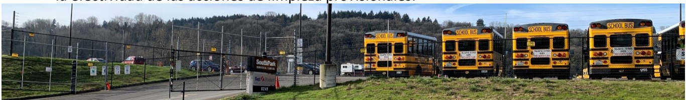
South Park Property Development (SPPD) desde 5th Avenue S.