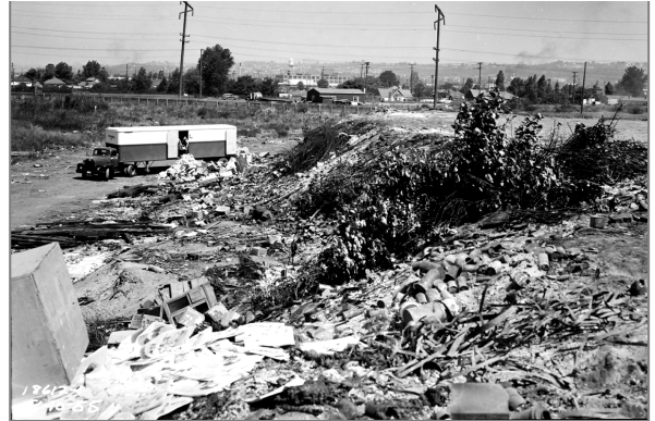
Uso histórico de South Park Landfill, alrededor de la década de 1950

Para 1970, se habían construido varias instalaciones sobre el antiguo vertedero, incluidas varias instalaciones de depósito de uso industrial y la Estación Sur de Reciclaje y Eliminación (South Recycling and Disposal Station, SRDS) construida por la ciudad de Seattle. De 1984 a 1996, el condado de King arrendó partes del sitio para almacenamiento, que en su mayoría consistía en almacenamiento de camiones.