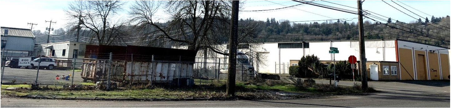
កន្លែងសម្អាត South Park Landfill ពី S. Kenyon Street