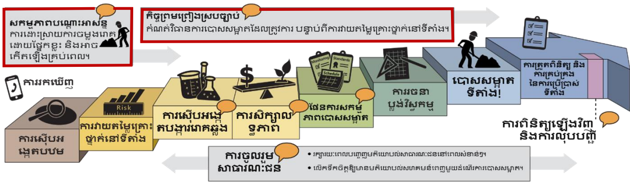
ដំណើរការសម្អាតជាផ្លូវការរបស់រដ្ឋ ( ទាញយកការពន្យល់អត្ថបទ )

ឯកសារពិនិត្យកំបស់នេះត្រូវបានគូសបញ្ជាក់ខាងក្រោមជាពណ៌ក្រហម។