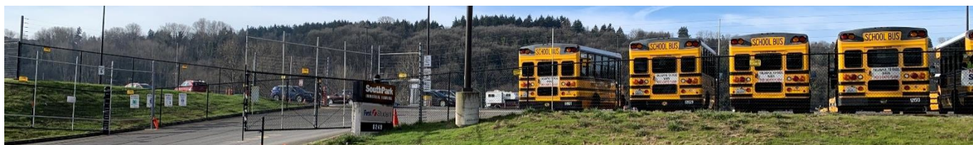
South Park Property Development (SPPD) រើ 5th Avenue S.