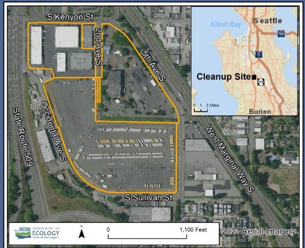
ផែនទីអាកាសនៃ South Park Landfill រួមទាំងព្រំដែនកម្មសិទ្ធិ។ តំបន់ចាក់សម្រាម 2021

ecology.wa.gov/Accessibility ។ សម្រាប់សេវាបញ្ជូនបន្ត ឬ TTY ទូរសព្ទទៅលេខ 711 ឬ 877-833-6341។