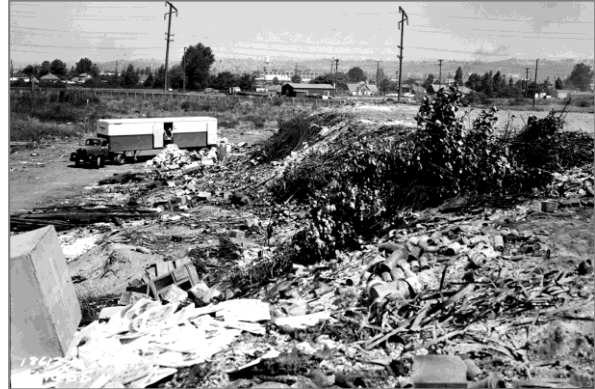
ប្រវត្តិសាស្ត្រនៃការប្រើប្រាស់ South Park Landfill ប្រហែលសតវត្សឆ្នាំ 1950

នៅឆ្នាំ 1970 គ្រឿងបរិក្ខារជាច្រើនត្រូវបានសាងសង់នៅលើអគីតកន្លែងចាក់សម្រាម រួមទាំងឃ្នាងស្តុកទំនិញដែលប្រើក្នុងឧស្សាហកម្ម និងទីក្រុងជាច្រើនទៀតនៃ South Recycling and Disposal Station របស់ទីក្រុង Seattle។ ចាប់ពីឆ្នាំ 1984 ដល់ឆ្នាំ 1996 King County បានជួលកន្លែងខ្លះនៃទីតាំងសម្រាប់ផ្ទុកដែលភាគច្រើនរួមមានកន្លែងផ្ទុករថយន្ត។