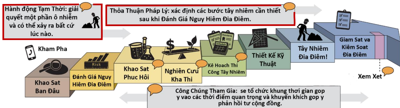
Quy trình làm sạch chính thức của Washington ( tải xuống phần giải thích bằng văn bản )

Mọi tài liệu xem xét của cơ sở này đều được tô viền đỏ như bên dưới.