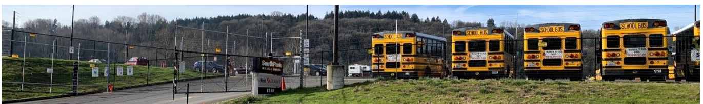
从 5th Avenue S. 看向 South Park Property Development (SPPD)