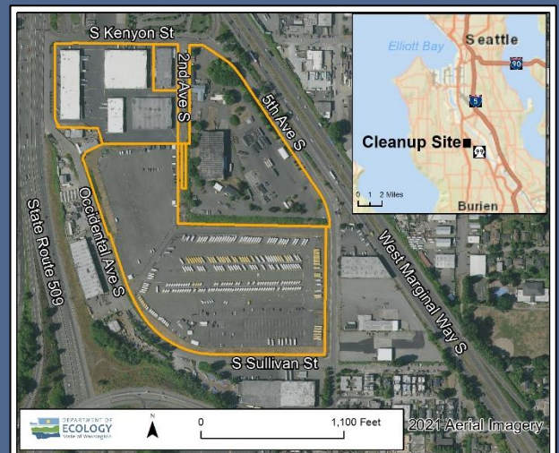
South Park Landfill 鸟瞰图 清理现场，2021 年

如需申请美国残疾人法案 (Americans with Disabilities Act, ADA) 便利措施，请致电 425-229-3683 或发送电子邮件至 LDW@ecy.wa.gov ，或访问 ecology.wa.gov/Accessibility 。中继服务或 TTY 请拨打 711 或 877-833-6341。