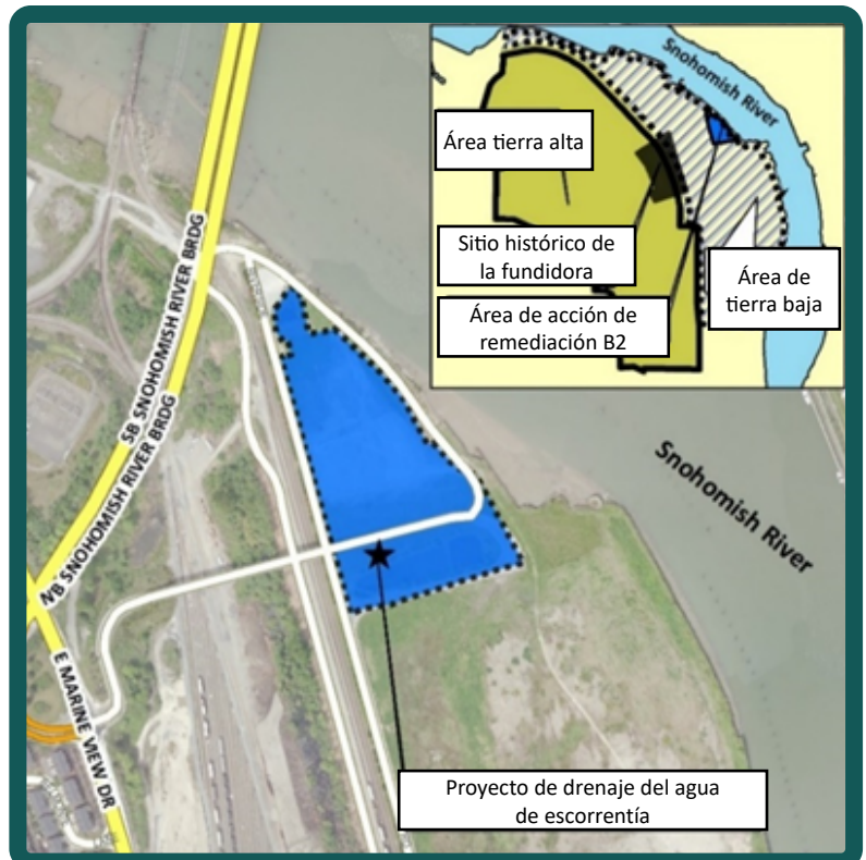
El área de trabajo de aguas pluviales (área B2) se encuentra a lo largo del río Snohomish, justo al este del puente del río Snohomish.

Para proteger al río Snohomish y las comunidades que dependen de él, en el 2023, Ecología y la Ciudad instalaron la primera fase de revestimientos dentro de las tuberías agrietadas para prevenir que el agua subterránea penetre el sistema. La segunda (y final) fase de revestimientos se instalará a fines del otoño del 2023.