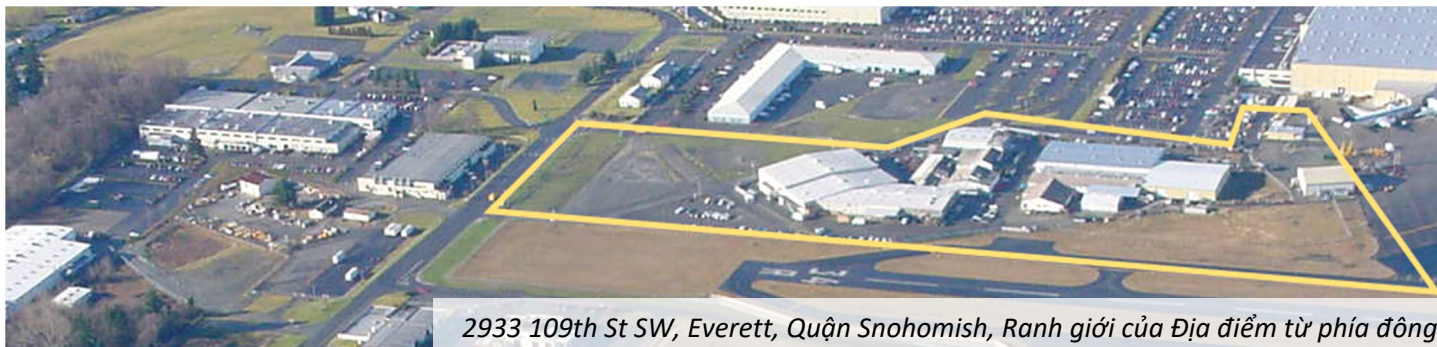
2933 109th St SW, Everett, Quận Snohomish, Ranh giới của Địa điểm từ phía đông