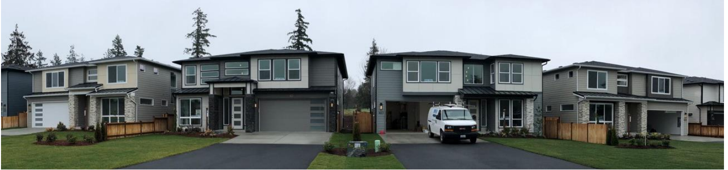
Redevelopment after cleanup at the Haack Parcel