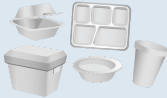
ካብ ሰነ 1፣ 2024 ይጀመር