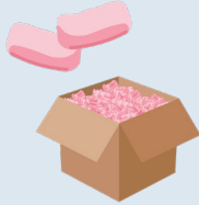
ካብ ሰነ 1፣ 2023 ይጀመር