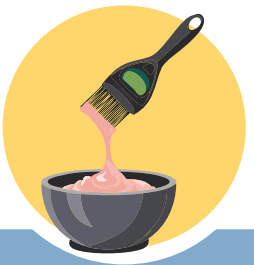
m និង o ផេនីលឡេនេដ្យាមីន