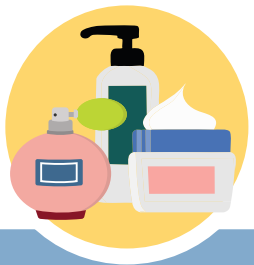
ទ្រីកូសាន