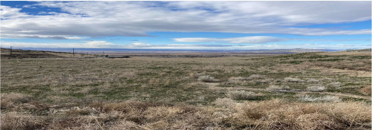
Snipes Mountain Landfill