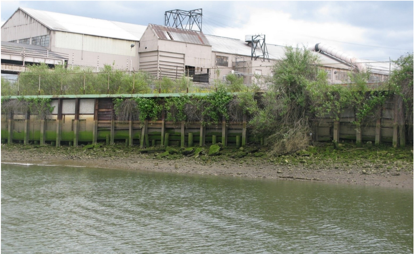
Panel separador de madera del Port of Seattle en el lado norte del sitio.