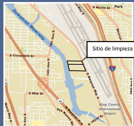
Mapa aéreo del sitio de limpieza de Boeing Isaacson Thompson.

Para solicitar una adaptación de la Ley para Estadounidenses con Discapacidades (Americans with Disabilities Act, ADA), comuníquese con Ecology por teléfono al 425-229-3683 o envíe un correo electrónico a LDW@ecy.wa.gov , o visite ecology.wa.gov/accessibility . Para solicitar el servicio de retransmisión de Washington o TTY, llame al 711 o al 877-833-6341.