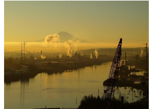
Vista de Lower Duwamish Waterway

Este sitio se extiende a lo largo del Sitio Superfund Lower Duwamish Waterway 1 , que consiste en un tramo de 5 millas del Duwamish River. La Agencia de Protección Ambiental (Environmental Protection Agency, EPA) de Estados Unidos añadió el Superfund Site de Lower Duwamish Waterway (LDW) 2 a la Lista Nacional de Prioridades del Superfund en 2001. Ecology está trabajando para detener o reducir las fuentes de contaminación del Sitio Superfund LDW, un trabajo conocido como “ control de fuente ” 3 , para que la EPA pueda proceder con la limpieza de los sedimentos del río. Este sitio se encuentra en el tramo superior, el área del río en la que se iniciará la limpieza de los sedimentos a partir de 2024. La limpieza de sedimentos adyacente a este sitio se pospuso para alinearse con la limpieza de las tierras altas para garantizar que las fuentes estén suficientemente controladas.