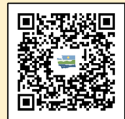
ស្វែងរកដើម្បីទទួលបានព័ត៌មានចុងក្រោយបំផុតអំពីព័ត៌មាន ផ្លូវទឹក Lower Duwamish Waterway

មកផ្ទាល់៖ Duwamish River Community Hub 8600 14 th Ave. South Seattle, WA 98108