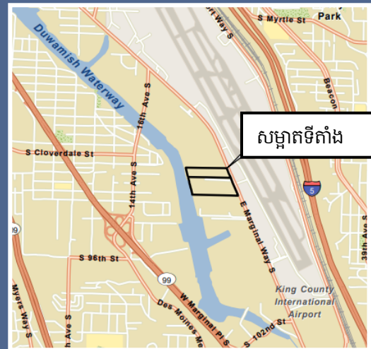
ផែនទីពីលើអាកាសរបស់ក្រុមហ៊ុន Boeing Isaacson ទីតាំងសម្អាត Thompson ។

សម្រាប់សេវាបញ្ជូនបន្ត ឬ TTY សូមទូរសព្ទទៅលេខ 711 ឬ 877-833-6341 ។