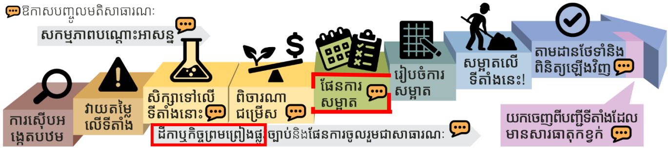
ដំណើរការសម្អាតផ្លូវការរបស់រដ្ឋ Washington

ឯកសារពិនិត្យឡើងវិញរបស់ទីតាំងនេះត្រូវបានរៀបរាប់ខាងក្រោមដោយពណ៌ក្រហម។