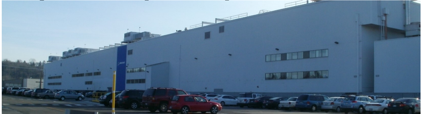
8701 E. Marginal Way S., Tukwila, WA.