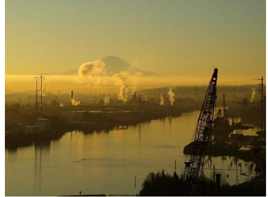
Quang cảnh Lower Duwamish Waterway

Địa Điểm này nằm dọc theo Địa Điểm Superfund của Lower Duwamish Waterway 1 , bao gồm một đoạn Duwamish River dài 5 dặm. Cơ Quan Bảo Vệ Môi Trường (Environmental Protection Agency, EPA) Hoa Kỳ đã bổ sung Địa Điểm Superfund của LDW 2 vào Danh Sách Địa Điểm Superfund Ưu Tiên Cấp Quốc Gia (Superfund National Priorities List) vào năm 2001. Ecology đang nỗ lực ngăn chặn hoặc giảm thiểu các nguồn gây ô nhiễm Địa Điểm Superfund của LDW, một công tác được gọi là " kiểm soát nguồn " 3 , để EPA có thể tiến hành dọn dẹp trầm tích trong sông. Địa điểm này nằm ở khu vực Upper Reach của con sông nơi sẽ bắt đầu quá trình dọn dẹp trầm tích sớm nhất vào năm 2024. Việc dọn dẹp trầm tích gần Địa Điểm này đã được hoãn lại cho phù hợp với hoạt động dọn dẹp khu vực cao nhằm đảm bảo các nguồn được kiểm soát đầy đủ.