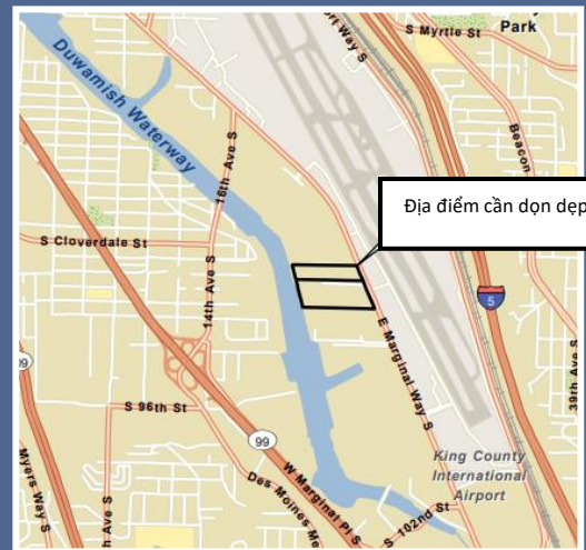
Bản đồ địa điểm cần dọn dẹp Boeing Isaacson Thompson nhìn từ trên không.

Để yêu cầu sắp xếp theo ADA (Đạo Luật Người Khuyết Tật Hoa Kỳ (Americans with Disabilities Act, ADA)), hãy liên hệ với Ecology qua số điện thoại 425-229-3683, địa chỉ email LDW@ecy.wa.gov hoặc trang web ecology.wa.gov/Accessibility . Đối với Dịch Vụ Chuyển Tiếp hoặc Tiếp Âm (TTY), hãy gọi 711 hoặc 877-833-6341.