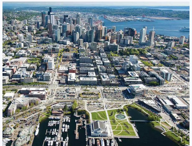
South Lake Union Neighborhood

《美国残疾人法》(Americans with Disabilities Act, ADA) 无障碍: 请通过以下方式联系 Department of Ecology: 致电 425-533-5537 或发送电子邮件至 Augie.Nuszer@ecy.wa.gov , 或访问 ecology.wa.gov/Accessibility 。中继服务或 TTY, 请拨打 711 或 877-833-6341。