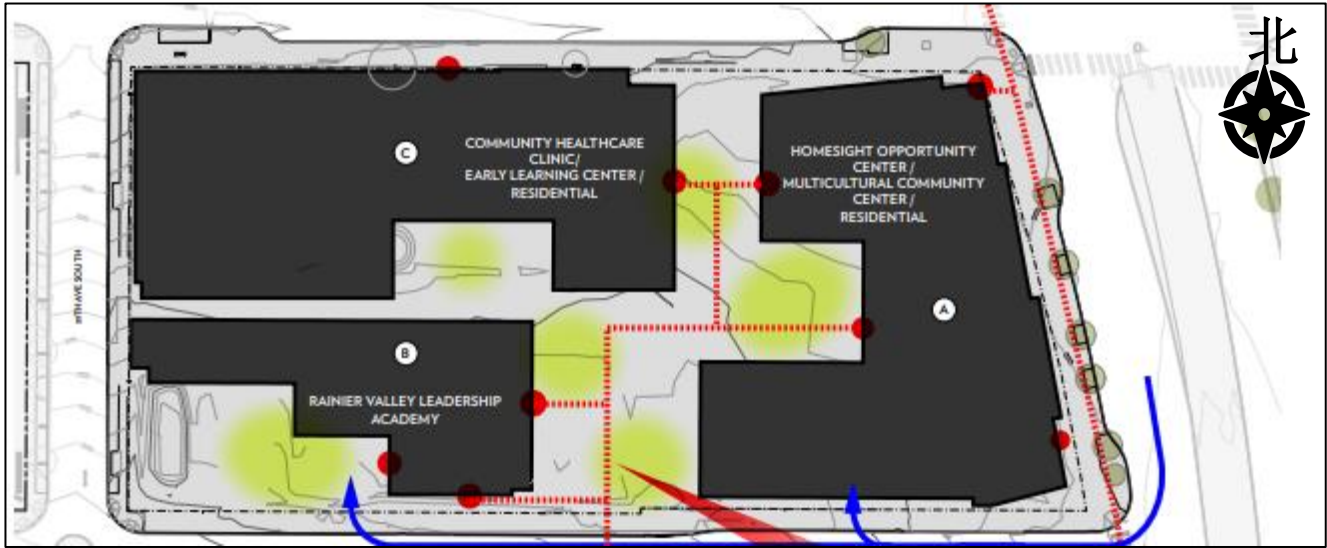
项目概念模型（图片：Weber Thompson）