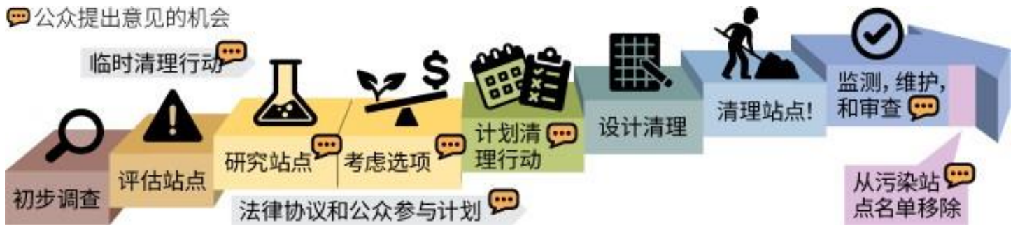
Washington 的正式清理程序（ 下载文字说明 6 ）

MTCA 是 Washington 的环境清理法。它规定了污染现场的清理要求，并制定了保护人类健康和环境的标准。Ecology 负责制定 MTCA 并监督清理工作。在可变的时间表内分步完成 MTCA 清理程序 5 （见下图）。