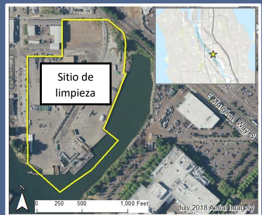
Mapa aéreo del sitio de limpieza de Crowley Marine.

Para solicitar una adaptación de la ADA, comuníquese con Ecology por teléfono al 425-533-5537 o envíe un correo electrónico a LDW@ecy.wa.gov , o visite ecology.wa.gov/accessibility . Para solicitar el servicio de retransmisión de Washington o TTY, llame al 711 o al 877-833-6341.