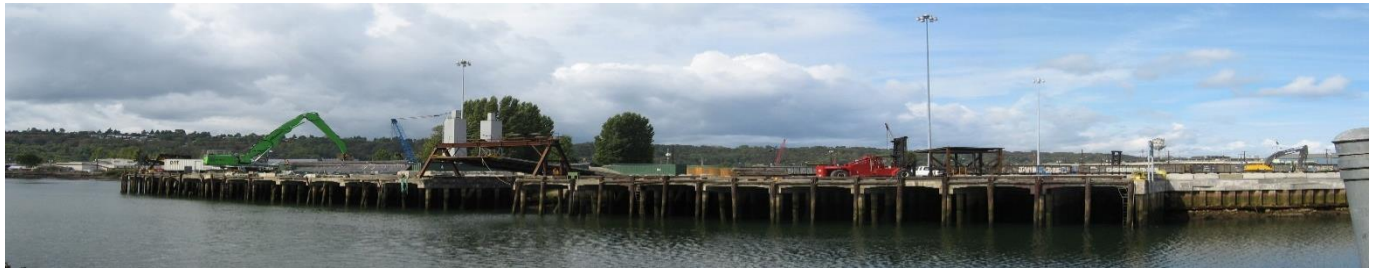
Imagen 2: Crowley Marine visto desde el suroeste.