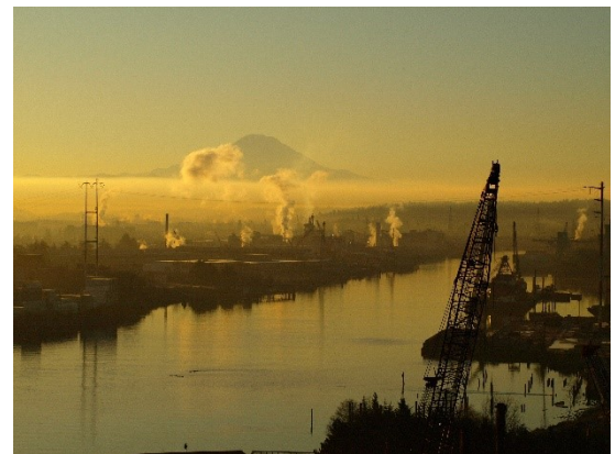
图 3: Lower Duwamish Waterway 现场

Dawn Food Products 场地毗邻 Lower Duwamish Waterway 3 Superfund Site，其中包括一段 5 英里长的 Duwamish River。美国环保署 (Environmental Protection Agency, EPA) 于 2001 年将 LDW Superfund Site 4 列入超级基金国家优先事项清单 (Superfund National Priorities List)。生态部正在努力阻止或减少 LDW Superfund Site 的污染源，该项工作名为“ 污染源控制 5 ”，以便环保署能够继续清理河床沉积物。