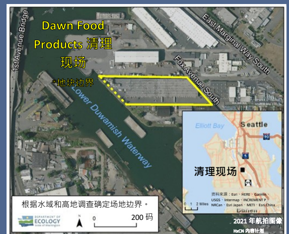
Dawn Food Products 鸟瞰图 清理现场

如需申请《美国残疾人法案》(Americans with Disabilities Act of 1990, ADA) 特殊照顾，请致电 425-533-5537 联系生态部，或发送电子邮件至 LDW@ecy.wa.gov ，或访问网站 ecology.wa.gov/Accessibility 。中继服务或听障专线 (TTY)，请拨打 711 或 877-833-6341。