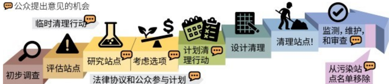
图 2: 华盛顿 (Washington) 州正式清理程序

《有毒物质控制示范法》( Model Toxics Control Act, MTCA 1 )是华盛顿 (Washington) 州环境清洁法。该法规定了污染现场的清理要求，并制定了人类健康和环境的保护标准。生态部负责执行 MTCA 清理程序 2 并监督清理工作。