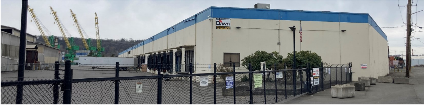
Lower Duwamish Waterway 主楼