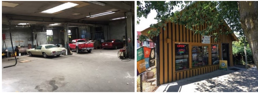
عمليات إصلاح السيارات السابقة Rainier Ave S 5021