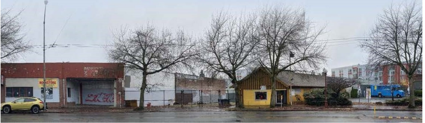
موقع Morningside Acres