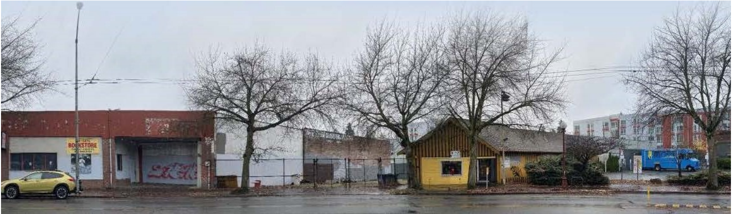
Ubicación del sitio Morningside Acres