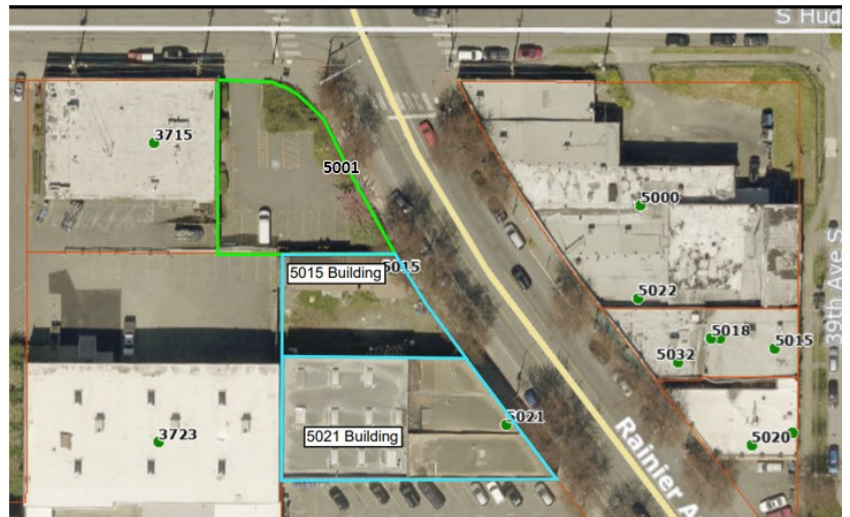
Vista aérea del sitio de limpieza

La necesidad de un PPCD en este Sitio surge de los usos históricos que se le dieron a la propiedad. Las parcelas norte (5001 Rainier Ave S), centro (5015 Rainier Ave S) y sur (5021 Rainier Ave S) de este Sitio tienen diferentes historias. La parcela norte se utilizó por al menos durante dos generaciones para estaciones de servicio, desde 1927 hasta el principio de la década de 1970. La parcela central se utilizó como un almacén de madera aproximadamente desde 1926 hasta 1965, como la oficina de un agente de seguros desde 1966 hasta 1980 y como una tienda de conveniencia desde 1980 hasta la actualidad. La parcela sur se utilizó, en momentos diferentes, como taller de mantenimiento y reparaciones automotrices, concesionaria de botes y autos, distribuidora de artículos de plomería, salón de billar, centro deportivo, y, actualmente, como una librería. Estos usos previos que se le dieron al Sitio provocaron la contaminación del suelo y del agua subterránea con petróleo y solventes clorados, cuyo alcance se determinará mediante la investigación de recuperación.