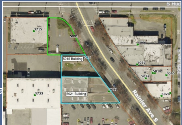
Vista aérea del sitio de limpieza