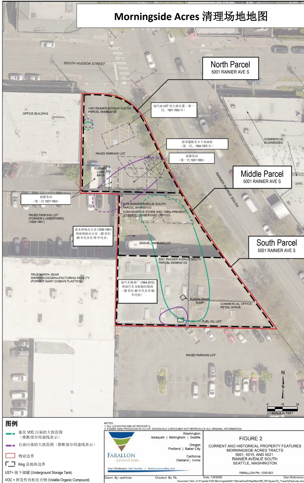
清理场地污染和当前及历史物业特征

改编自: Final Remedial Investigation and Feasibility Study Report and Draft Cleanup Action Plan (最终补救调查和可行性研究报告及清理行动计划草案) (图 2, 第 74 页), 2023 年 11 月 14 日, Farallon Consulting.