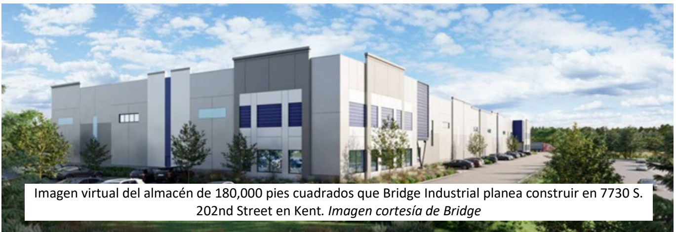
Imagen virtual del almacén de 180,000 pies cuadrados que Bridge Industrial planea construir en 7730 S. 202nd Street en Kent.

El redesarrollo incluirá un nuevo almacén de 178,700 pies cuadrados, con un muelle de carga de concreto y asfalto, carreteras y estacionamiento. Se instalarán una nueva planta de aguas pluviales y conexiones a servicios públicos. Se creará un nuevo humedal en el lado este de la propiedad. Para más detalles, llame a Kyle Siekawitch al 425-749-4325 o escriba a ksiekawitch@bridgeindustrial.com .