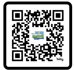
MAPA DIRT ALERT

El programa Dirt Alert! es una colaboración con el Departamento de Salud del condado Tacoma-Pierce que brinda información, recursos y alcance comunitario a las comunidades dentro del Penacho de la Fundición de Tacoma. El mapa del programa indica cuáles residencias se han muestreado, cuáles propiedades son elegibles para reemplazo de suelo, y cuáles propiedades han recibido reemplazo de suelo. Escanee el código QR a la derecha o visite Ecology.wa.gov/DirtAlertMap .