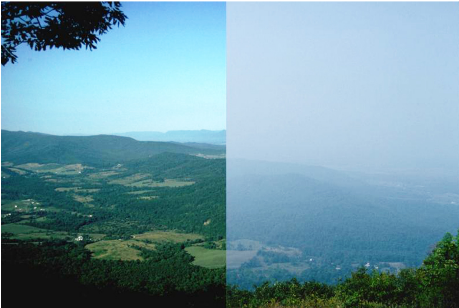
Comparison of a clear view and regional haze